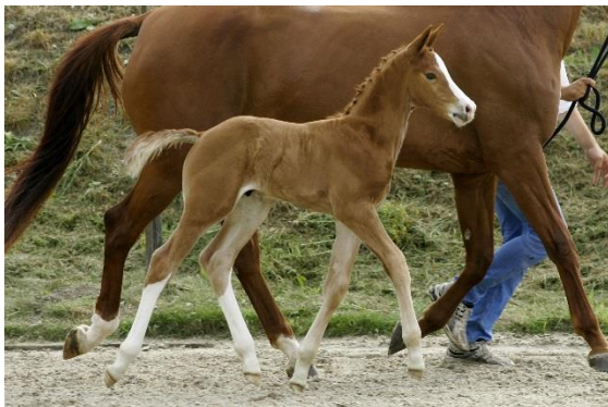
17. Imperial de Baian (Everdale x Jazz)

De legendarische Parcival is weer in training en op tijd fit om af te reizen naar het EK in Denemarken eind deze maand. Dit jaar wordt er uit de volle zus van Parcival een Everdale-veulen geveild tijdens de Nationale Veulenvailing Prinsjesdag. Op de foto- videodag op 27 juli was het veulen nog erg jong maar de selectiecommissie was onder de indruk.