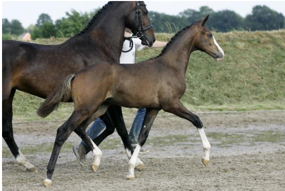
9. Imposant (Charmeur x Krack C)

Deze talenvolle jonge hengsten zijn gecombineerd met bewezen moederlijnen. Er worden op 17 september drie Charmeur-nakomelingen en één Desperado-veulen geveild.