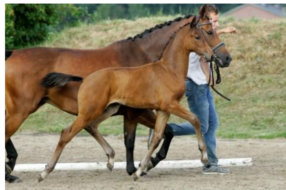
16. Insider (Desperado x Stedinger)

Afgelopen week werd het Wereldkampioenschap voor jonge dressuurpaarden in Verden verreden. Meerdere vaderpaarden zetten hun beste beentje voor in de diverse dressuurrubrieken. O.a. Desperado en Charmeur verschenen aan de start.